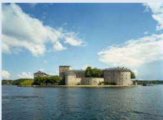
Vaxholms fästning där det en gång började

D en första ännu verksamma militära kamratföreningen i Sverige bildades i december 1899. Det var Kamratföreningen Vapenbröderna knuten till Vaxholms artillerikår. Som ett litet kuriosum kan nämnas att vapenslaget kustartilleriet bildades först tre år senare 1902. Då blev benämningen KA 1, Vaxholms kustartilleriregemente. Det dröjde ända till första världskrigets utbrott 1914 innan nästa kamratförening, Älvsborgs krigareförening, som den ursprungligen hette, såg dagens ljus. Däremot var det inte andra världskriget som innebar starten för huvuddelen av dagens kamratföreningar. Dessa bildades efter hand åren 1925 till 1939 under intryck av nedrustningen fram till 1936. Det sades ju som bekant efter första världskriget att det inte skulle bli något mer världskrig.