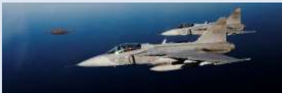
Kamrater i Flygvapnet.

av en eventuell riksorganisation. Även om kamratföreningsrörelsen var opolitisk ville man dock kunna göra sin stämma hörd. Framför allt ville man kunna deltaga i olika manifestationer som t.ex. Svenska Flaggans Dag och den särskilda årliga vårparaden i Stockholm som inleddes 1939. Ett förslag presenterades redan 1934. Det kom från Fälttelegrafisternas kamratförening, nu Signaltruppernas kamratförening, där man föreslog ett centralråd. Det vann emellertid inte odelat gillande och verksamheten fortsatte att baseras på frivillig samverkan från fall till fall.