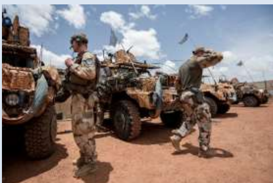
Kamrater i utlandsmission.

I de flesta förening finns kamrater – officerare och civilanställda – som tjänstgjort och alltjämt tjänstgör nationellt och i vissa fall internationellt inom försvarsmakten. Många föreningar erbjuder även tidigare värnpliktiga möjlighet till medlemskap. På senare år har dörren öppnats för medlemskap till personer som står utanför Försvarsmakten, men som har ett intresse för försvaret och som, på olika sätt, önskar stödja förbandets kamratförening. Detta oaktat om förbandet alltjämt är verksamt eller är nedlagt.