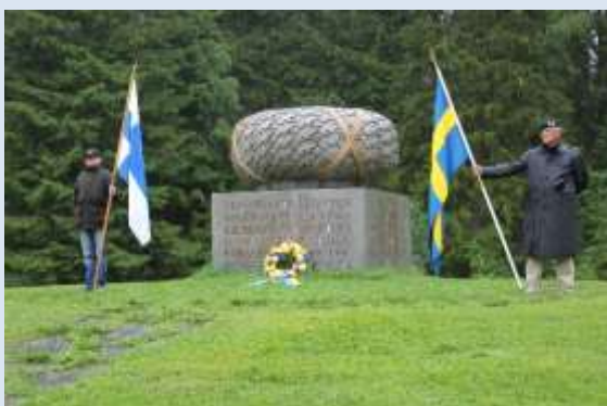
Kamrater från de nordiska länderna hedrar offer från VK II

SMKR har tecknat en överenskommelse med Försvarsmakten som bland annat innefattar ovanstående delar. Här har kamratföreningarna i landet en stor och viktig uppgift att fylla.