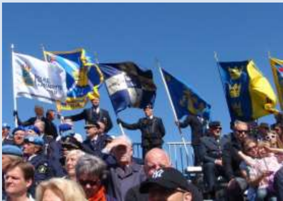
SMKR fana flankerad av Lapplands Jägare och Flottans Män under Veterandagen.

SMKR är en del av de fem ideella organisationer Sveriges Veteranförbund Fredsbaskrarna (SVF), Svenska Soldathemsförbundet (SSHF), Invidzonen (IZ) och Idrottsveteranerna (IV) som, på uppdrag av Försvarsmakten, stödjer utlandsveteraner och deras anhöriga på olika sätt.