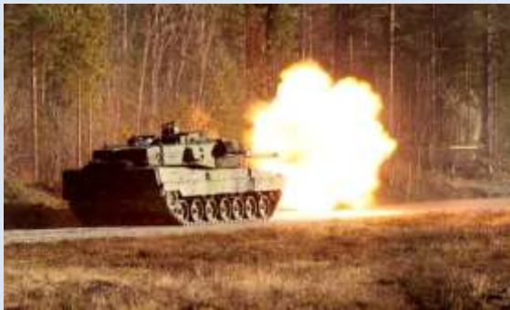
Kamrater i Armén.

sig i förbandens ceremoniella verksamhet, t.ex. försvarsdagar.