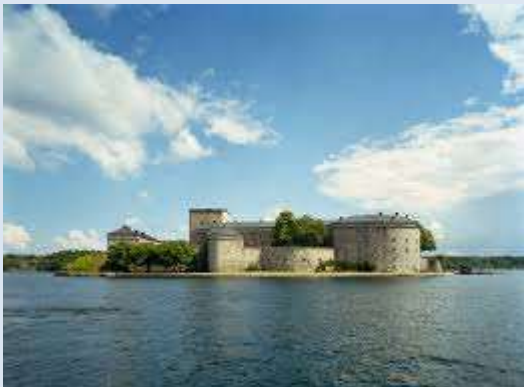
Vaxholms fästning där det en gång började

D en första ännu verksamma militära kamratföreningen i Sverige bildades i december 1899. Det var Kamratföreningen Vapenbröderna knuten till Vaxholms artillerikår. Som ett litet kuriosum kan nämnas att vapenslaget kustartilleriet bildades först tre år senare 1902. Då blev benämningen KA 1, Vaxholms kustartilleriregemente. Det dröjde ända till första världskrigets utbrott 1914 innan nästa kamratförening, Älvsborgs krigareförening, som den ursprungligen hette, såg dagens ljus. Däremot var det inte andra världskriget som innebar starten för huvuddelen av dagens kamratföreningar. Dessa bildades efter hand åren 1925 till 1939 under intryck av nedrustningen fram till 1936. Det sades ju som bekant efter första världskriget att det inte skulle bli något mer världskrig.