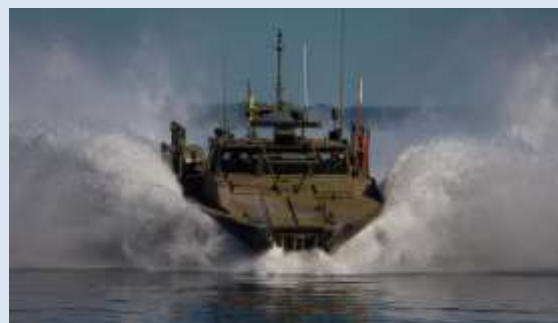
Kamrater i Marinen.

sin verksamhet efter 1927, bildades av befäl och/eller värnpliktiga vid de regementen som drogs in med 1925 års försvarsbeslut. Några av dessa är alltså verksamma, t.ex. Föreningen Smålands husarer. Men även vid många av de regementen som levde vidare, skapades kamratföreningar. Den största kamratföreningen då liksom nu är den 1935 instiftade Flottans Män, som tillika är vår enda vapenslagsförening, och även ett riksförbund inom riksförbundet SMKR.