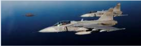
Kamrater i Flygvapnet.

av en eventuell riksorganisation. Även om kamratföreningsrörelsen var opolitisk ville man dock kunna göra sin stämma hörd. Framför allt ville man kunna deltaga i olika manifestationer som t.ex. Svenska Flaggans Dag och den särskilda årliga vårparaden i Stockholm som inleddes 1939. Ett förslag presenterades redan 1934. Det kom från Fälttelegrafisternas kamratförening, nu Signaltruppernas kamratförening, där man föreslog ett centralråd. Det vann emellertid inte odelat gillande och verksamheten fortsatte att baseras på frivillig samverkan från fall till fall.