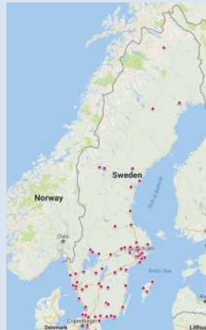
Karta över Kamratföreningarnas spridning

dag finns kamratföreningsrörelsen spridd över hela landet, från Kiruna i norr till Ystad i söder.