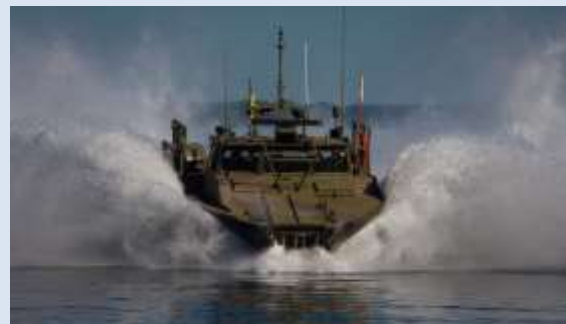
Kamrater i Marinen.

sin verksamhet efter 1927, bildades av befäl och/eller värnpliktiga vid de regementen som drogs in med 1925 års försvarsbeslut. Några av dessa är alltså verksamma, t.ex. Föreningen Smålands husarer. Men även vid många av de regementen som levde vidare, skapades kamratföreningar. Den största kamratföreningen då liksom nu är den 1935 instiftade Flottans Män, som tillika är vår enda vapenslagsförening, och även ett riksförbund inom riksförbundet SMKR.