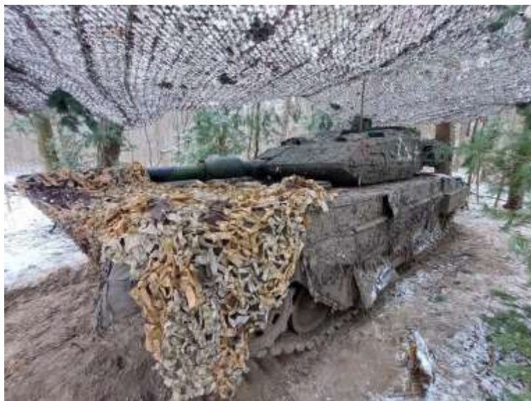
Brigadens (vår) stridsvagn 122 Leopard 2A6

Denna bilaga innehåller information från vår 21.Mekaniserade Brigad (Svenskbrigaden) som strider i ryska KURSK Oblast.